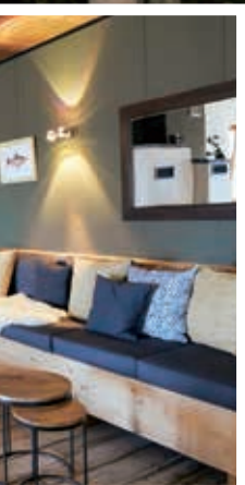
Lauschige Stunden am Kamin: Im neu gestalteten Seehaus sitzen die Gäste am Feuer und blicken auf den Chiemsee