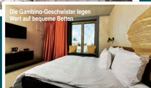
Die Gambino-Geschwister legen Wert auf bequeme Betten