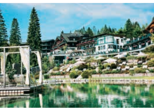
Luxus auf höchstem Niveau! Das „Astoria Resort“ von außen und der riesige Badesee