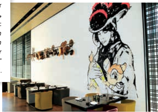
Feine Asia-Bissen: Im Restaurant „Moriki“ soll im Sommer die erste Party des Jahres stattfinden