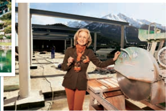
Wellness für Seele und Körper bieten im „Astoria“ Top-Therapeuten