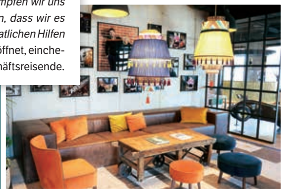
Treffpunkt Lobby: Das riesige Ledersofa lädt zum Chillen ein